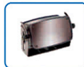
SENSOR RADAR BIRCHER